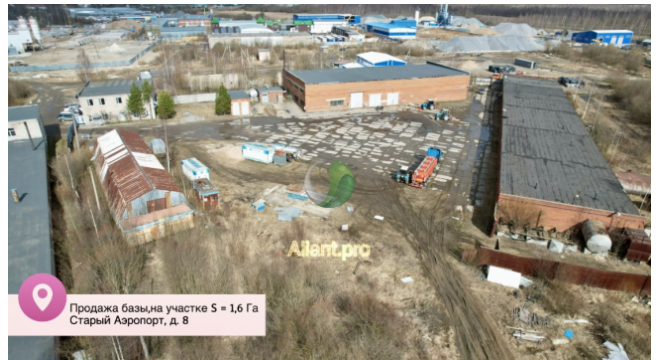
Продажа базы на участке S = 1,6 Га Старый Аэропорт, д. 8