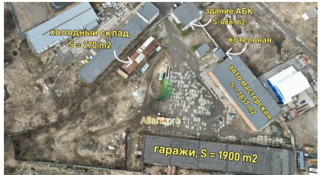
холодный склад, S = 270 м2 здание АБК S = 486 м2 котельная автомастерская S = 1832 м2 гаражи, S = 1900 м2