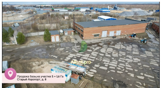
Продажа базы на участке S = 1,6 Га Старый Аэропорт, д. 8