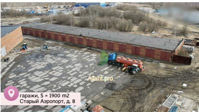
гаражи, S = 1900 м2 Старый Аэропорт, д. 8