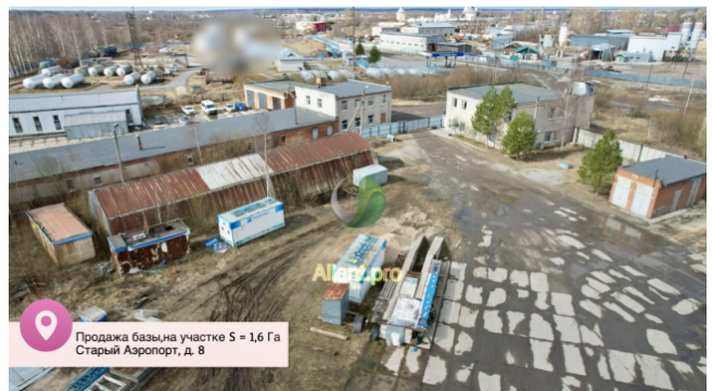
Продажа базы на участке S = 1,6 Га Старый Аэропорт, д. 8