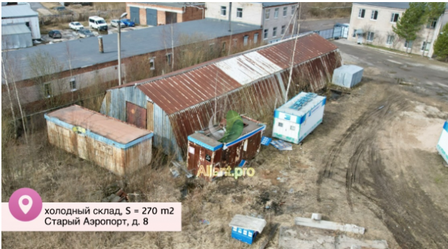
холодный склад, S = 270 м2 Старый Аэропорт, д. 8