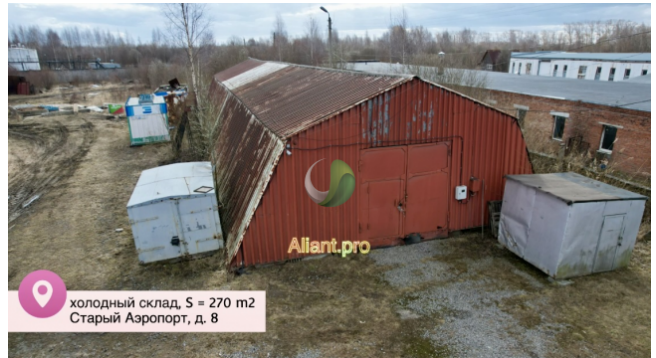
холодный склад, S = 270 м2 Старый Аэропорт, д. 8