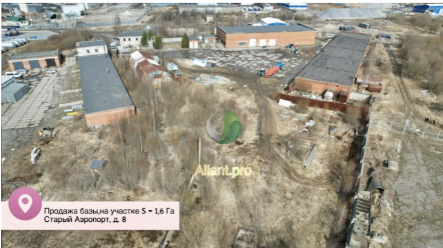
Продажа базы на участке S = 1,6 Га Старый Аэропорт, д. 8