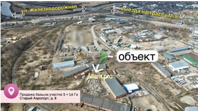
Продажа базы на участке S = 1,6 Га Старый Аэропорт, д. 8